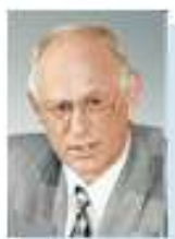
Председатель Попечительского Совета Негосударственного пенсионного фонда «Образование и наука» Бальгин Григорий Артемович — Председатель Комитета Госдумы РФ по образованию

Руководят Фондом известные и авторитетные люди: Слайд № 14